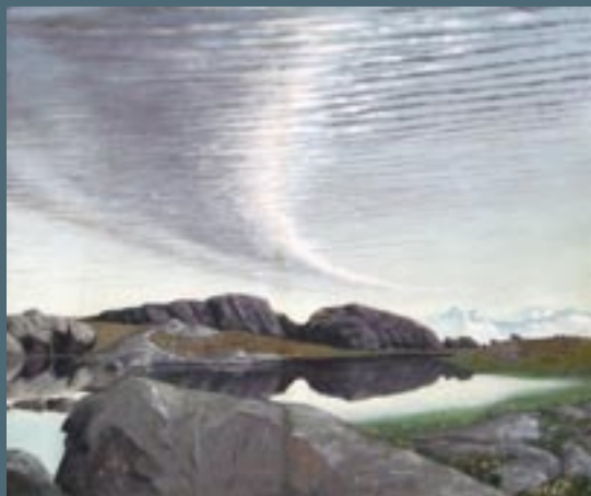
Emil Müller-Ewald, Bergsee in den Dolomiten, um 1929, 42 x 51 cm, Tempera auf Hartfaser, Mittelrhein-Museum Koblenz, M 654

Dieses hoffnungsvolle Spektrum künstlerischen Schaffens wurde nach 1933 radikal unterbrochen. Künstler fanden sich wieder zwischen Emigration und Anpassung. Nach dem Zweiten Weltkrieg „internationalisierte“ sich die Kunst und ging andere Wege.