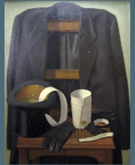
Martin Mendgen, Stilleben mit Herrenkleidung, 1932, 82 x 63 cm, Öl/Sperholz, Stadtmuseum Simeonsstift Trier, III 1472

Dabei werden nicht nur die Künstler des „Künstlerbunds Westmark“ zu sehen sein, sondern die Ausstellung beleuchtet auch deren unmittelbares Umfeld. Keiner der gezeigten Künstler hat den Schritt in die gegenstandslose Kunst vollzogen. Sie teilen das Schicksal der „verschollenen Generation“: Ihr Realismus galt nach dem Zweiten Weltkrieg nicht mehr als zeitgemäß, einige von ihnen waren gar Mitläufer der Nazi-Diktatur. Trotzdem stellt ihr Schaffen ein wichtiges Kapitel der Kunstentwicklung nicht nur im Rheinland dar.