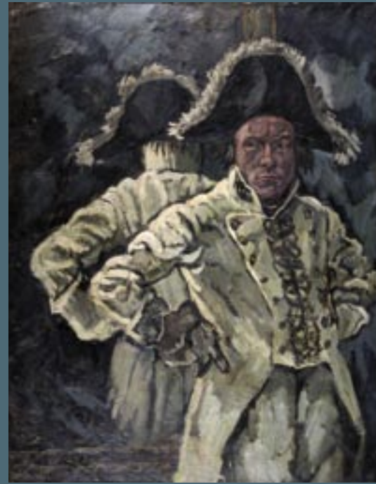
Hanns Sprung, Der Schauspieler Kai Möller, um 1927, 145 x 115 cm, Öl/Leinwand, Mittelrhein-Museum Koblenz, M 233