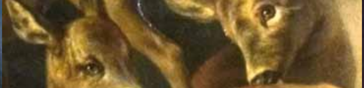
Gustav Zick: Rehe auf einer Waldwiese, 1863 (Inv.-Nr. M 45)