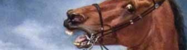
Simon Meister: Reiterbildnis, 1830 (Inv.-Nr. M 287)