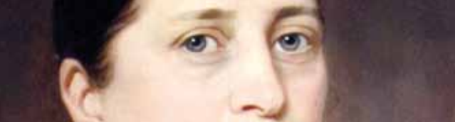
Peter Vogel: Portrait der Frau Kolter, 1889 (Inv.-Nr. M 462)