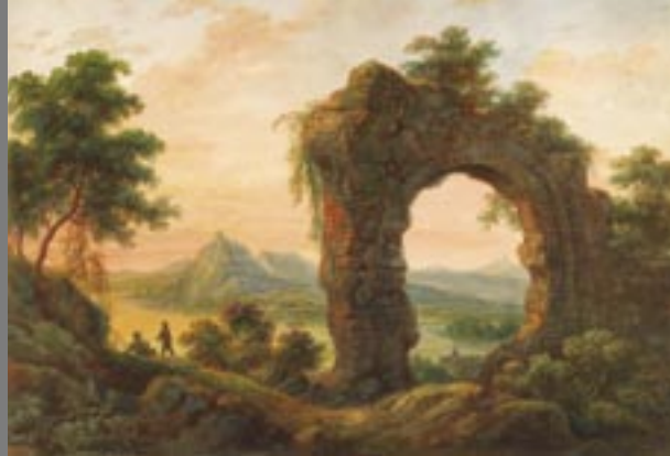
Franz Josef Manskirsch zugesch., Rolandsbogen und Siebengebirge, nach 1825