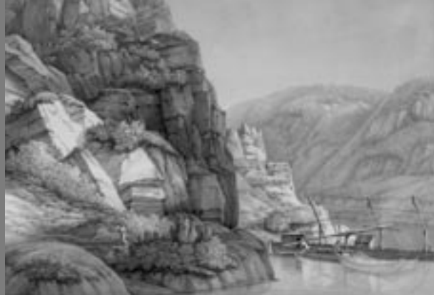
Christian Georg Schütz, Lorelei, um 1803/04

Titel: Christian Georg Schütz, Ansicht von Oberwinter, 1799