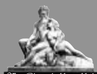
Vater Rhein und Mutter Mosel