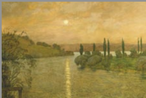
Hans Thoma, Der goldene Rhein, 1912

Den Übergang zur Moderne vermitteln Werke des um 1900 populärsten deutschen Landschaftsmalers Hans Thoma. An der Schwelle zum Symbolismus stehen beispielhaft die Ansicht der Loreley von Oswald Achenbach oder Hermann Hendrichs „schlafende Brünhilde im Siebengebirge“.