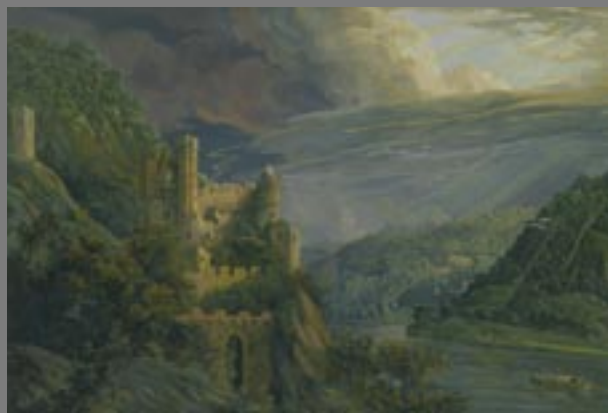
Unbekannt, Schloß Rheinstein von Süden, 1791

Die bisher weitgehend unveröffentlichten Kunstwerke aus Privatbesitz belegen die Bedeutung der Kulturlandschaft am Rhein für die Entwicklung der deutschen Romantik und der Landschaftsmalerei im 19. und 20. Jahrhundert. Sie sind damit ein druckvolles Zeugnis der Kulturgeschichte einer Region, die zu Recht den Rang eines UNESCO-Welterbes besitzt.