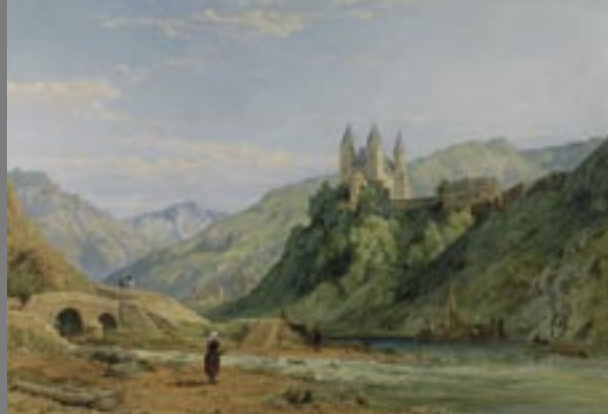
Clarkson Stanfield, Kloster Arnstein, 1864