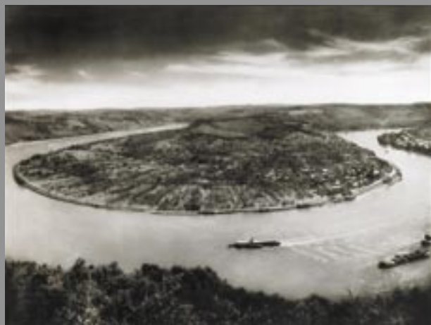
August Sander, Rheinschleife bei Boppard, 1938