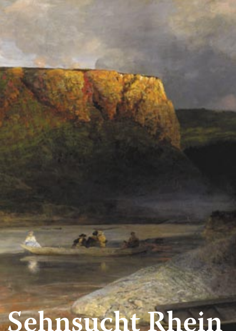
Bildnachweis: Foto August Sander © Die Photographische Sammlung/SK Stiftung Kultur - August Sander Archiv, Köln, VG Bild-Kunst, Bonn, 2007, alle anderen Abbildungen (Aussschnitte) © Sammlung Siebengebirge, c/o Siebengebirgsmuseum der Stadt Königswinter, Titel: Oswald Achenbach, Loreley, 1903