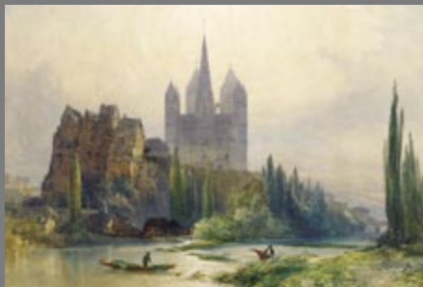
William Callow, Limburg an der Lahn, 1875

Eines der wenigen Gemälde des Bonner Universitätszeichners Nicolaus Christian Hohe (1798-1868) zeigt wie zahlreiche weitere Rheinansichten einen typischen Blick auf das Siebengebirge im Jahre 1861. Albert Flamms (1823-1906) Bonner Rheinufer lässt schon impressionistische Züge erkennen und verweist neben Werken des zeitgenössischen Künstlers Jürgen Schmitz auf die Moderne, deren Schwerpunkt im Koblenzer Mittelrhein-Museum zu sehen ist.