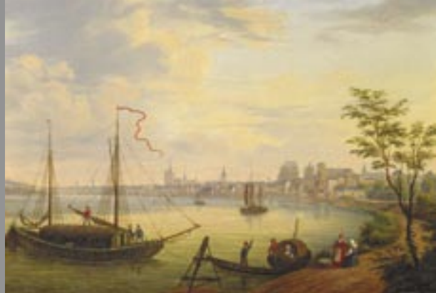
Nikolaus Christian Hebe, Köln von Norden, um 1840