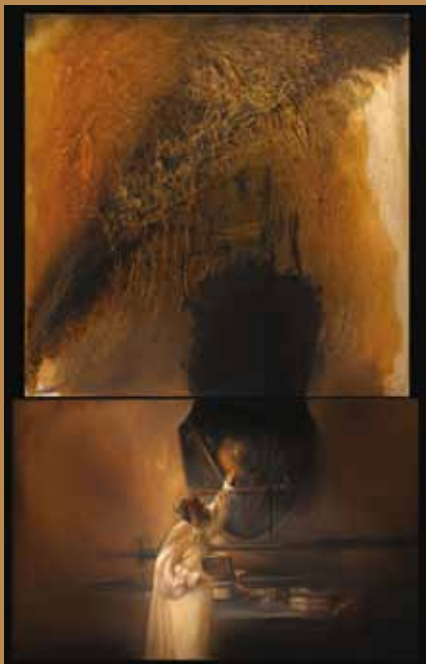
© aller Abbildungen: Antonio Máro und Rafael Ramírez