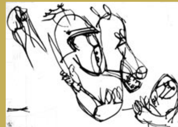
Markus Lüpertz: St. Martin für das Koblenzer Stift, Kaltnadelradierung, 2008