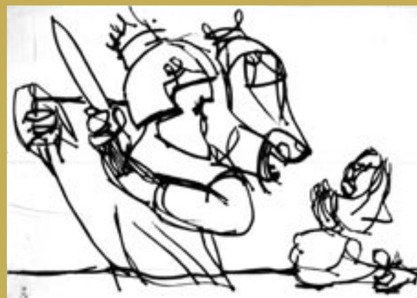
Markus Lüpertz: St. Martin für das Koblenzer Stift, Kaltnadelradierung, 2008

Die Stiftung Rheinland-Pfalz für Kultur fördert die Realisierung des „Lüpertz-Fensters“ mit einem namhaften Betrag. Unterstützen auch Sie dieses Gemeinschaftsprojekt: Die Erlöse aus dem Kauf Ihres „echten Lüpertz“ kommen vollständig dem Bau der Kapelle „St. Martin“ zugute.